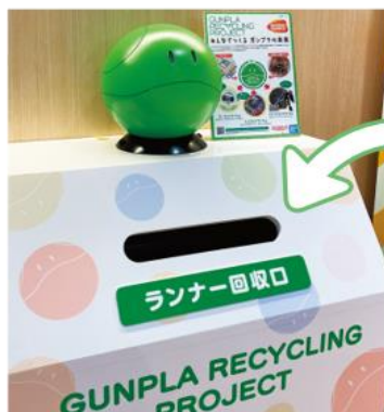
ランナー専用回収 BOX